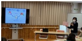
ボランティアセンター