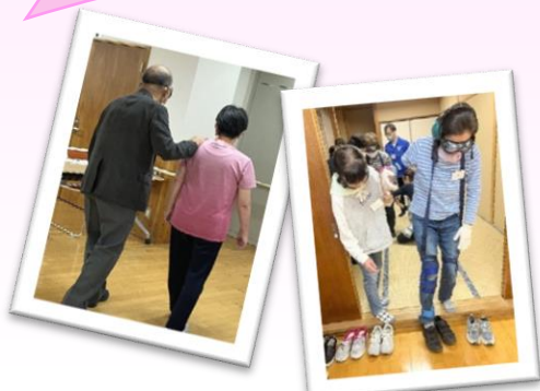
ブラインドウォーク体験