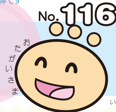
いちかわ社協マスコットキャラクターてるぼ