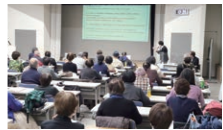
市民向け講演会の様子