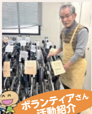
ボランティアさん 活動紹介