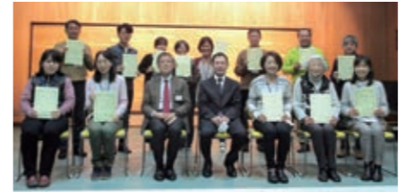
第2期市民後見人養成講座修了者

※てるぼサポート(福祉サービス利用援助事業)とは高齢者、知的障がい者、精神障がい者などで、金銭管理等について不安のある方が、社会福祉協議会と契約を結び、サポートを受ける事業。(契約に不安のある方は利用することができません)