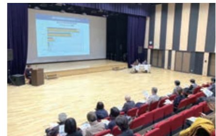
「後見人のつどい」の様子